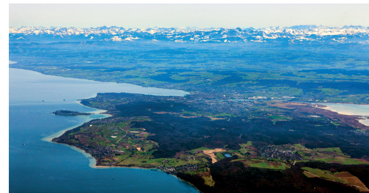
Konstanz-Wallhausen und die Alpen

Anmeldeformular und aktuelle Hinweise zu Programm, Unterkunft, Möglichkeiten der Mitarbeit und gegenseitiger Unterstützung: www.versoehnungsbund.de/friwo