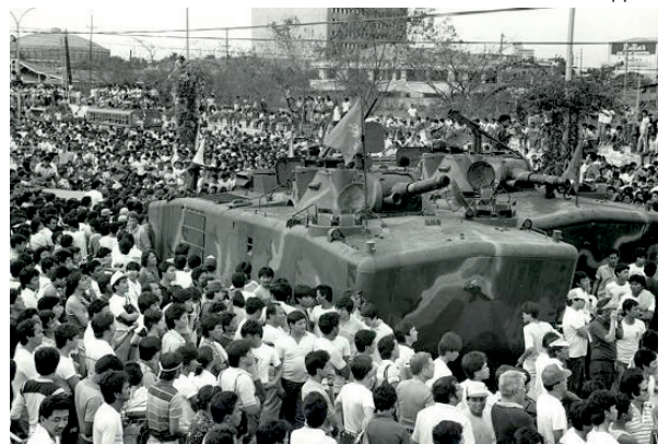
Rosenkranzrevolution auf den Philippinen

* „Gütekraft“ entspricht „Satyagraha“, dem Wort, das Mahatma Gandhi seine erfolgreiche Streikunst schuf. Sie fußt auf einer verbindenden Kraft, die in jeder und jedem geweckt werden kann. www.guetekraft.net