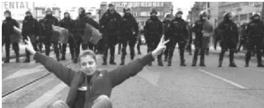
Protest in Tuzla

serbischen Pass. Die Identifikation mit ihrem Herkunftsland Bosnien-Herzegowina ist daher äußerst gering.