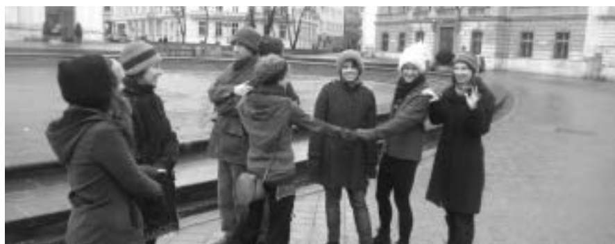
Bildertheater am Karlsplatz

Alles in allem können wir auf ein spannendes Wochenende zurückblicken. Die Auseinandersetzung sowohl mit dem „Wie“ von gewaltfreien Aktionen als auch mit dem Bildertheater war für uns nicht nur anregend und lustvoll, sondern auch emotional intensiv und reich an sichtbar gewordener Gruppendynamik. Das Konzept hat sich als sehr brauchbar erwiesen und kann bestimmt auch beim Peace Event Sarajevo erfolgreich umgesetzt werden. Wir sind schon gespannt, welche Bilder und Ausdrucksformen dort entstehen werden, wenn weitere Menschen aus verschiedenen kulturellen Zusammenhängen mit ihrer Kreativität und ihren Ideen den Workshop bereichern!